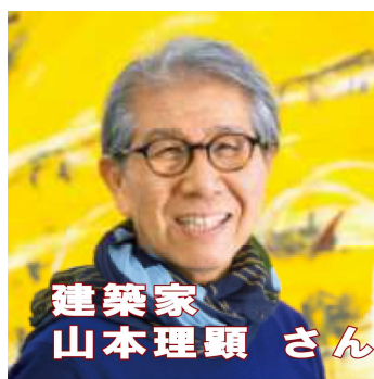
建築家 山本理顕 さん

みなさんの力を結集し、「カ ジノ計画の中止」「市民の自 治を守り、市民の声を聞く」 市長実現のために、選挙にむ けた活動交流をしましょう。